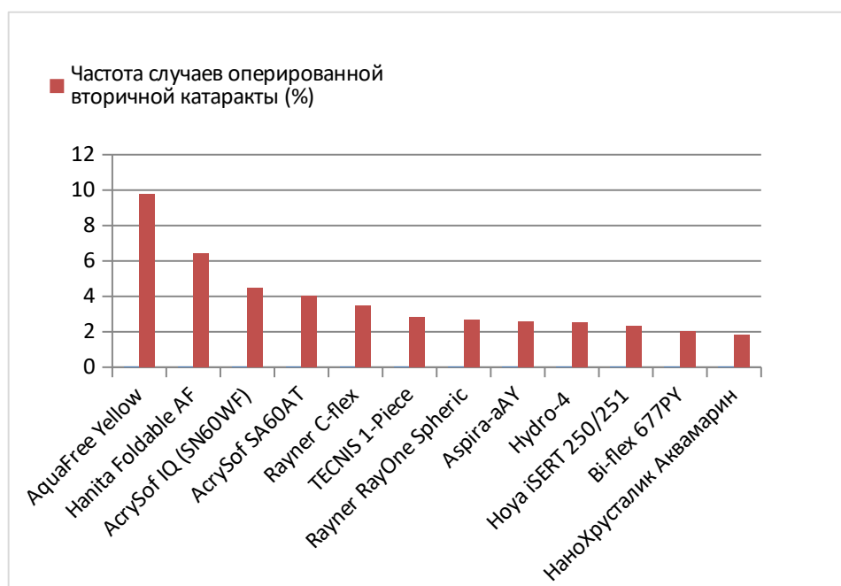
Рис. 2. Частота случаев оперированной вторичной катаракты при имплантации различных моделей ИОЛ.

Нередким явлением в афакичных глазах является развитие вторичной катаракты. Было доказано, что важную роль в предотвращении разрастания на задней поверхности хрусталиковой капсулы эпителиальных клеток играет физический барьер – квадратный край по периметру линзы [7,8]. Поэтому на данный момент большинство производителей стали использовать такую конструкцию в строении ИОЛ. Разные производители указывают разную технологию обработки заднего края оптической части линзы, однако процент развития вторичной катаракты при имплантации разных моделей ИОЛ в ОФ МНТК МГ находится приблизительно на одинаковом уровне. Лишь линзы Hanita Foldable AF, Rayner C-flex и AcrySof IQ не оправдали свои ожидания, и частота развития вторичной катаракты значительно превысила остальные случаи. ИОЛ AquaFree Yellow и AcrySof SA60AT не имеют никаких особенностей дизайна, предотвращающих миграцию эпителиоцитов по капсуле хрусталика, что проявляется на практике бóльшим количеством случаев развития вторичной катаракты (рис. 2).